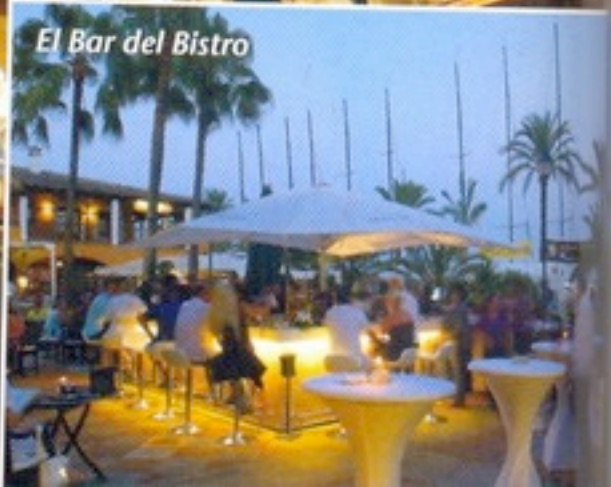
El Bar del Bistro